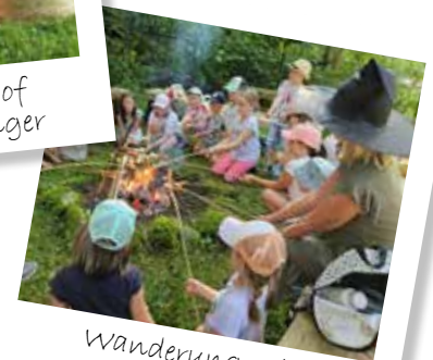
Wanderung mit Petronella Apfelmus