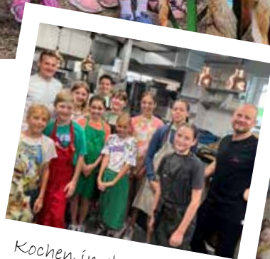
Kochen in der Schmiede