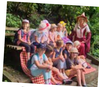
Märchenwanderung mit unserem BGM