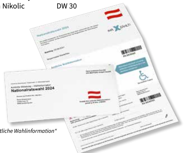
Muster „Amtliche Wahlinformation“