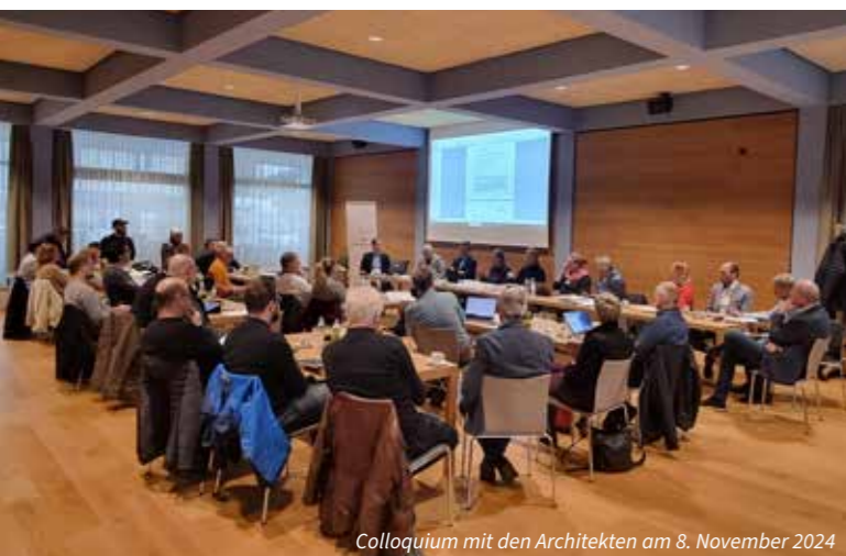
Colloquium mit den Architekten am 8. November 2024