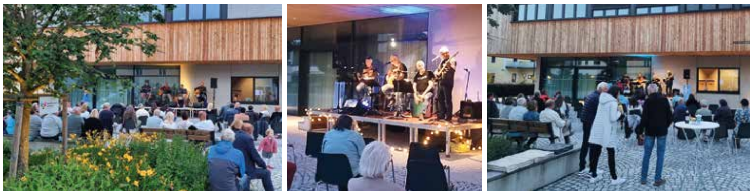
Am 11. Juli und am 1. August sorgten die bewährten Vöcklamarkter Bands für gute Stimmung.