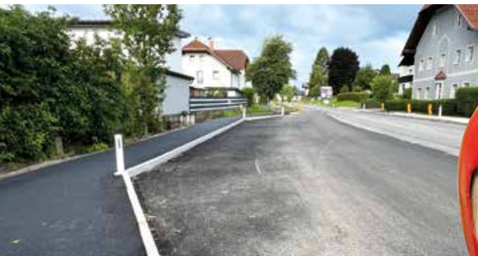
Die Arbeiten an der neuen Bushaltestelle samt Querungshilfe in Mösendorf sind fast abgeschlossen.