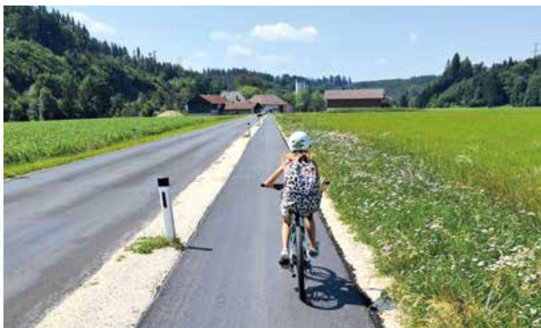
Großen Anklang findet der neue Geh- und Radweg an der Trenauer Straße.

• Beim Gasthaus „ Die Wirterei “ in Schmidham gab es bei den Donnerstag-Veranstaltungen immer wieder Probleme bei der Zufahrt und den Parkplätzen. Es liegt nun ein Ansuchen um Änderung dieser Situation vor. Der Gemeinderat hat der Einleitung der Änderungsverfahren Nr. 5.32 beim Flächenwidmungsplan und Nr. 3.11 beim Örtlichen Entwicklungskonzept zugestimmt.