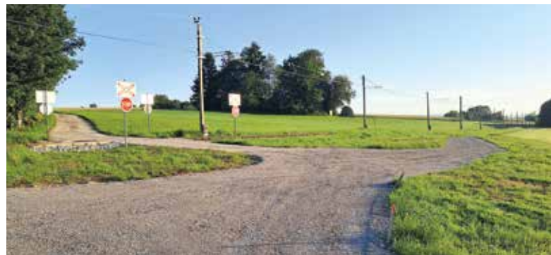
Umgestalteter Lokalbahnübergang im Bereich Schmidham.

• Im Bereich des Spielplatzes des Pfarrcaritas-Kindergartens war eine grundbücherliche Durchführung von Besitzänderungen erforderlich. Aufgrund eines lange zurückliegenden, aber nicht eingetragenen Kaufes wurden 35 m 2 unentgeltlich an die Eigentümer der Nachbarliegenschaft abgetreten. Die Vermessungs- und Eintragungskosten werden von diesen Eigentümern übernommen.