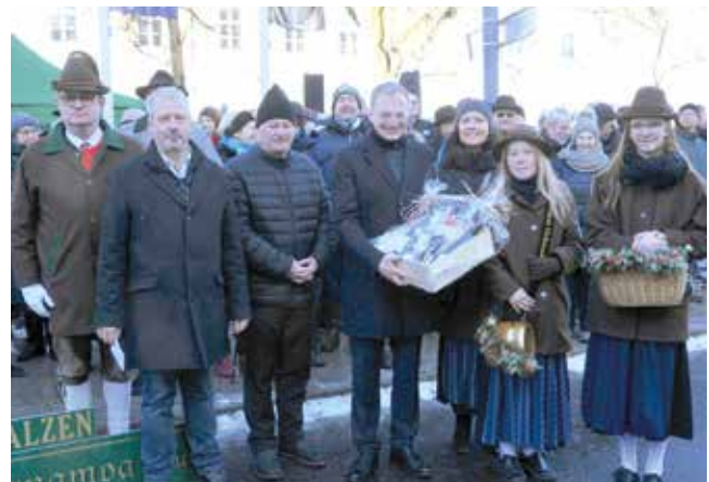
Die Abordnung aus Vöcklamarkt mit LH Mag. Thomas Stelzer.

Ein herzliches Dankeschön für die Einladung nach Linz und für die gelebte Kameradschaft – ein schöner Auftakt ins neue Jahr!