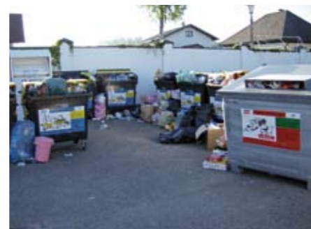
Dieses Bild gehört bald der Vergangenheit an.