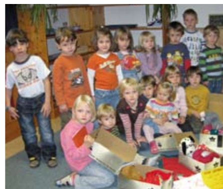
Foto: Die Kinder des Montessori – Kindergartens Vöcklamarkt haben heuer einen doppelten Grund sich auf Weihnachten zu freuen – weil sie auch anderen Kindern eine Freude machen konnten.

ein großes Anliegen war. Der Montessori – Kindergarten Vöcklamarkt wird seit über 15 Jahren erfolgreich als integrative Gruppe geführt. Die Kinder lernen so, aufeinander Rücksicht zu nehmen und Kinder mit einem Handicap profitieren durch die Integration in der Gruppe sowie durch die gezielte Förderung, auch mit Montessori – Materialien.